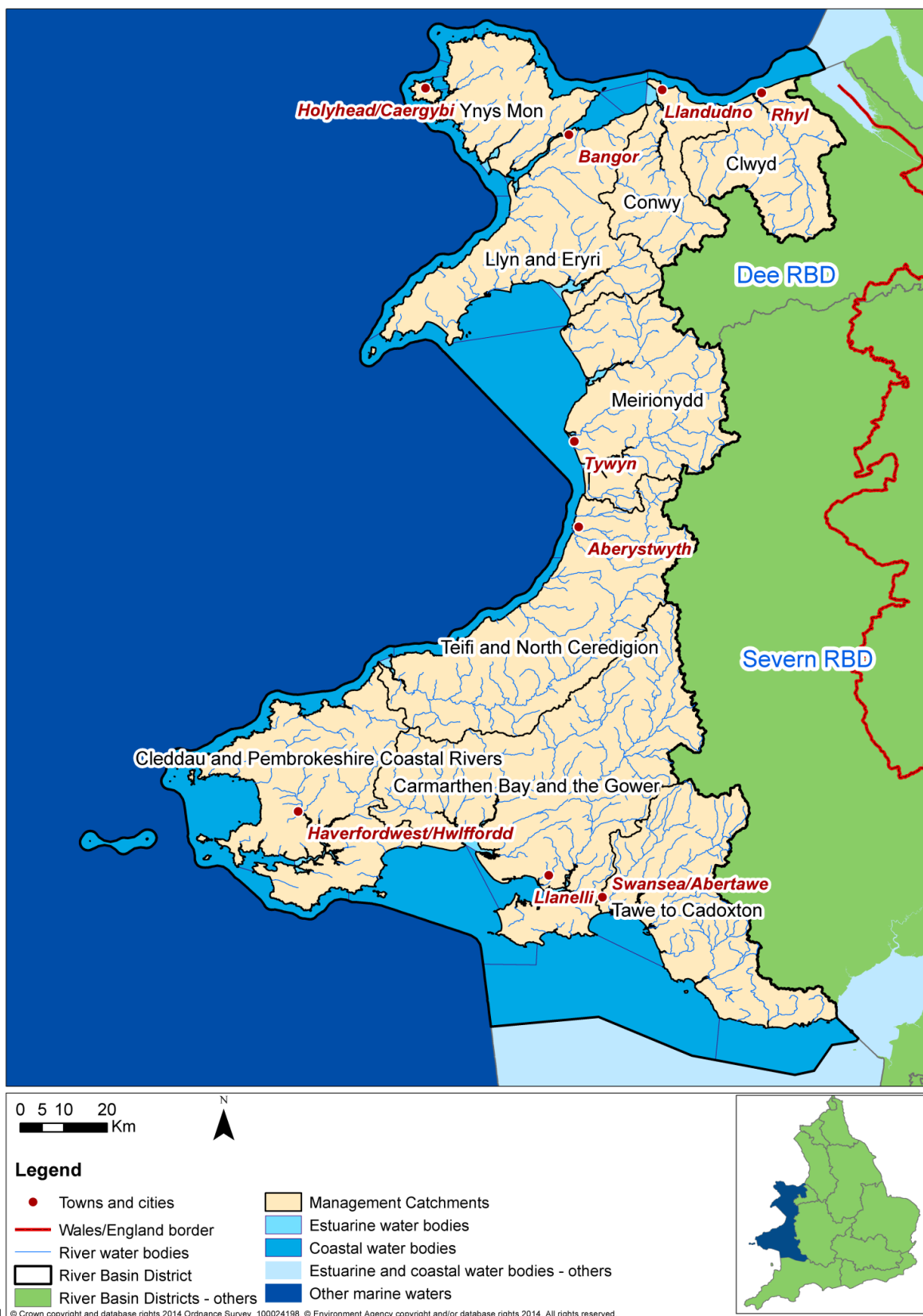
Ffigur 1.1: Dalgylchoedd Rheoli Ardal Basn Afon Gorllewin