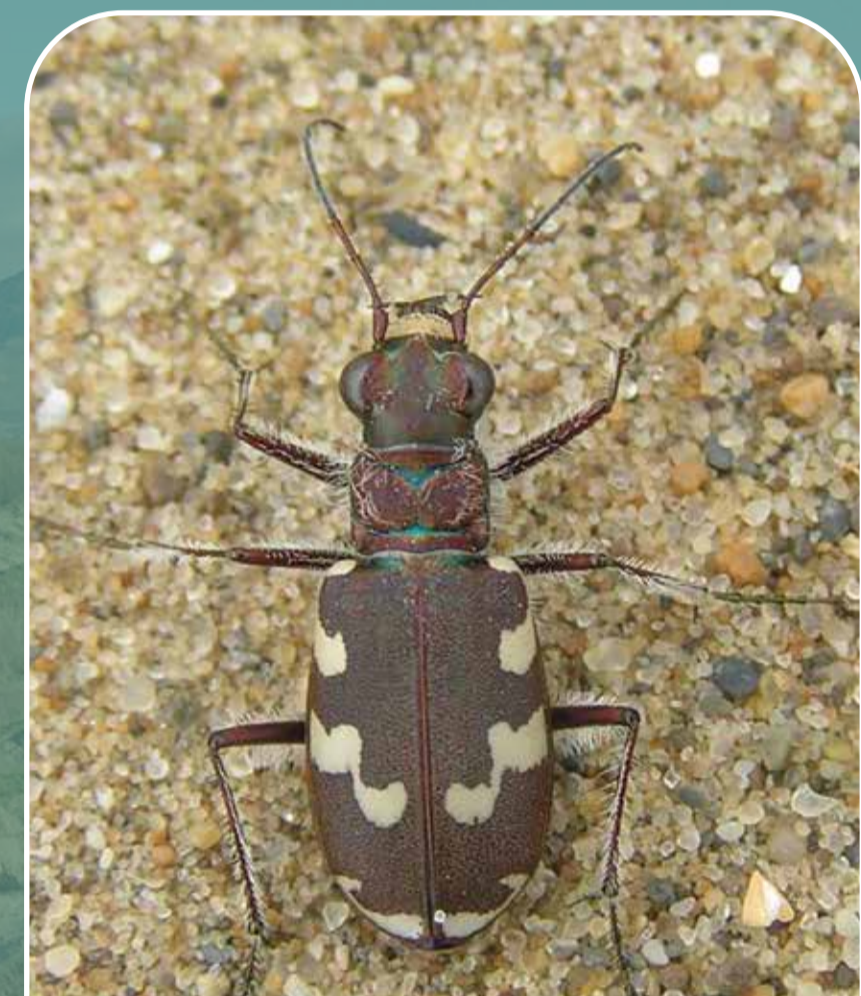
Chwilen deigr y twyni - Mae'r ysglyfaethwr prin ac arbenigol hwn yn bwydo ar bryfed llai Dune tiger beetle - This rare sand specialist predator feeds on smaller insects