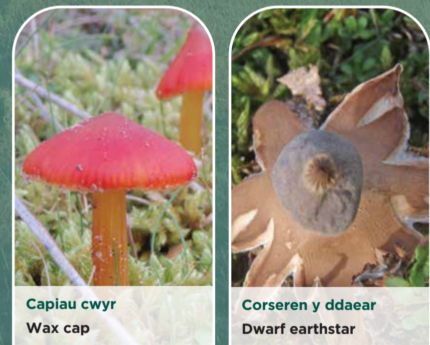
Capiau cwyr Wax cap