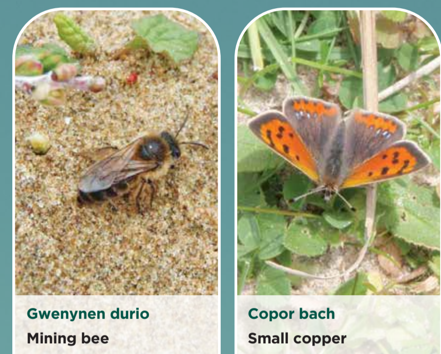
Gwenynen durio Mining bee