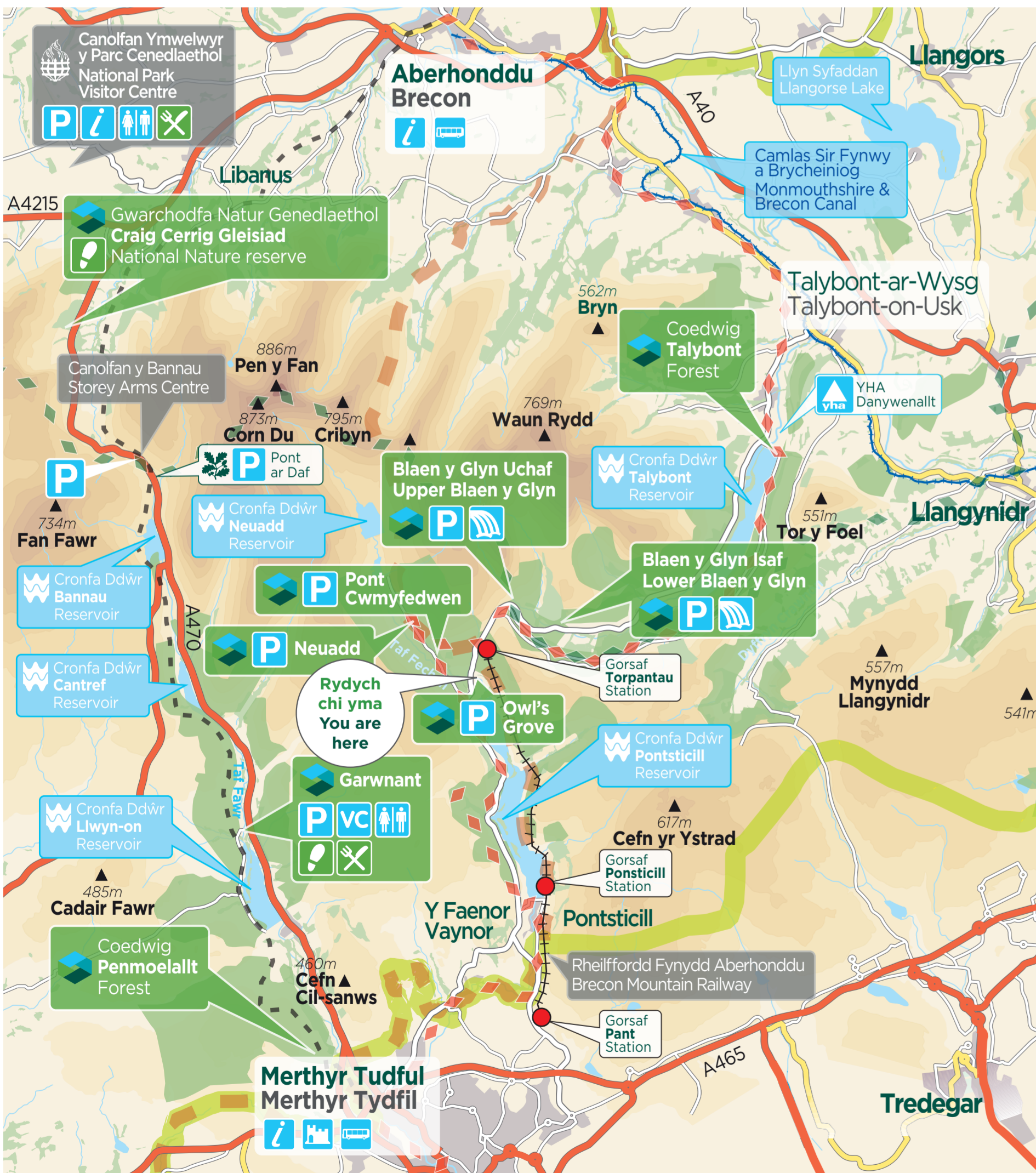
Atgynychir y map hon o ddiwyddiadau ym 2019 gan Ordnance Survey gyda chaniatâd Arolwg Ordnans ar ran Rheolwr Llyfrfa Eri Mawrdd. © Hawffaint y Goron a hawliau cronfa ddata 2019 Arolwg Ordnans 100019741. This map is based upon Ordnance Survey material with the permission of Ordnance Survey on behalf of the controller of Her Majesty's Stationery Office © Crown copyright and database rights 2019 Ordnance Survey 100019741.

To protect the reservoirs' water quality, the City Corporation where the water was needed bought the land around the proposed reservoir – and moved any inhabitants off it. Much of it was then leased to the Forestry Commission, who planted non-native conifers as they would grow quickly, stabilise the ground and reduce surface run off. These trees also provide a good return from timber sale.