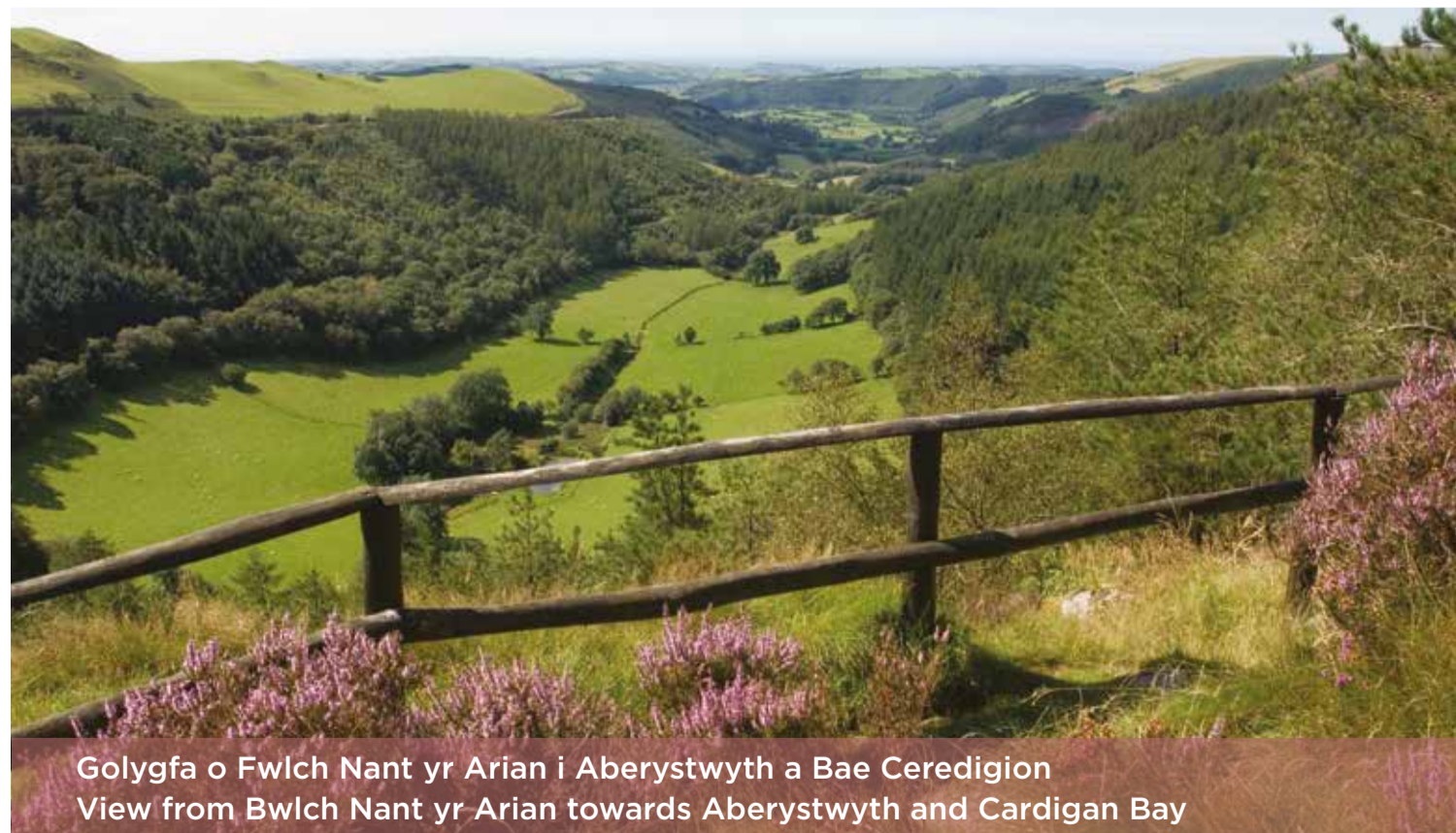
Golygfa o Bwlch Nant yr Arian i Aberystwyth a Bae Ceredigion View from Bwlch Nant yr Arian towards Aberystwyth and Cardigan Bay

Natural Resources Wales is proud to look after some real gems in this scenically dramatic yet tranquil part of Wales.