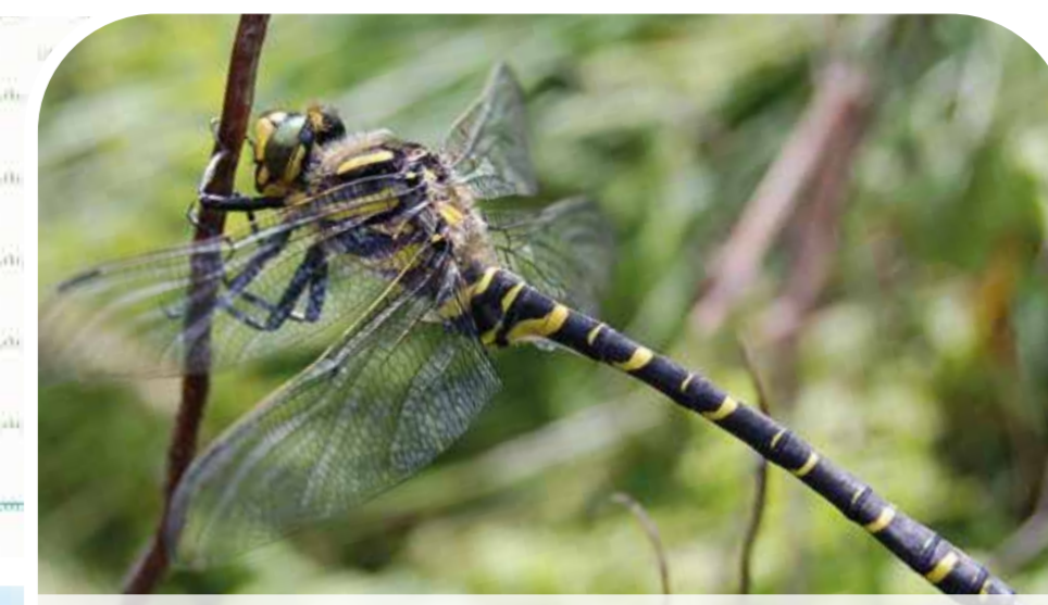
gwas neidr eurdorchog golden-ringed dragonfly