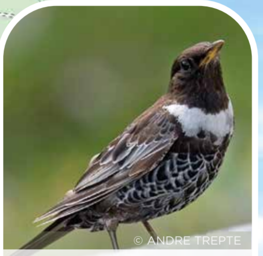
mwyalchen y mynydd ring ouzel